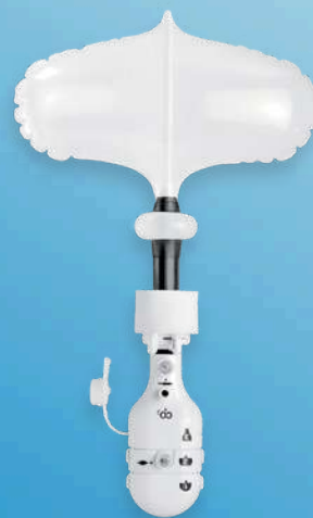
Spacemaker™ Plus Dissector System

INNOVATING. BY BEING IN TOUCH WITH YOUR NEEDS.