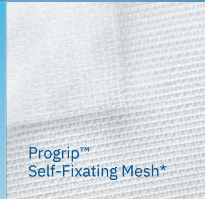
Progrip™ Self-Fixating Mesh*