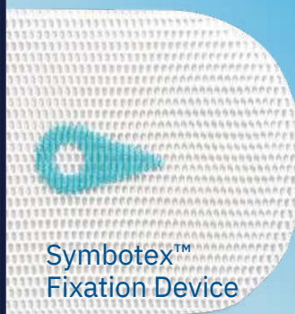
Symbotex™ Fixation Device