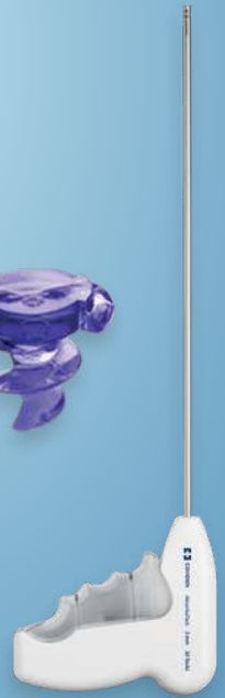
AbsorbaTack™ Fixation Device